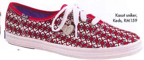
Kasut sniker, Keds, RM159