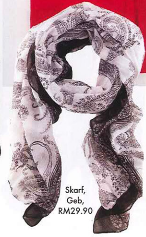
Skarf, Geb, RM29.90

Hangatkan dengan... Suntikan pop art koleksi jam tangan Bewatch Bart Verheyen dari Ice Watch. RM369 ini pasti mengundang jelingan.