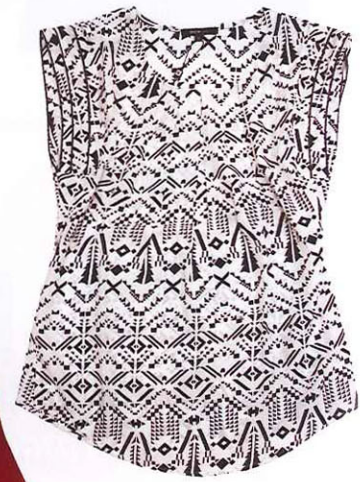
Top bercetak, Biem, harga tidak dinyatakan