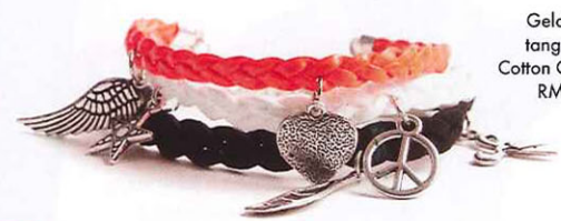
Gelang tangan, Cotton On, RM14